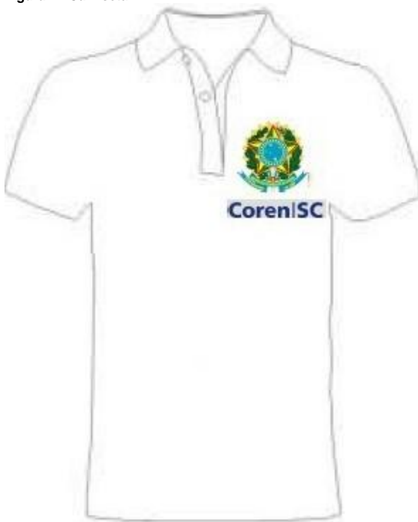
Figura 1 - Camiseta

As ilustrações a seguir não são arte final dos itens a que se referem. Representam a qualidade e formato geral que se pretende implementar, conforme descrito na Tabela 1. A arte final deverá acompanhar a ordem de execução.