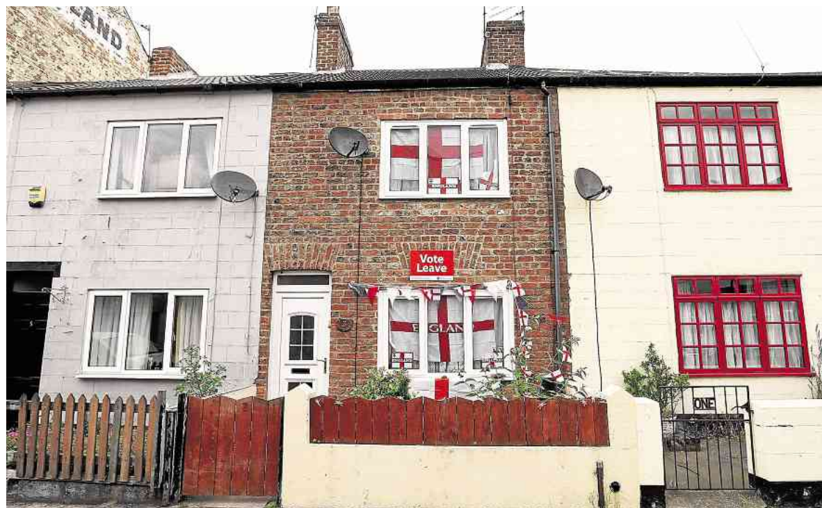
Casa em Redcar, norte da Inglaterra, ostenta bandeira de São Jorge, símbolo britânico, e cartaz pelo voto pró-saída

A chanceler ressaltou que alguns avanços são analisados nas áreas “de defesa, crescimento, emprego e competitividade”.