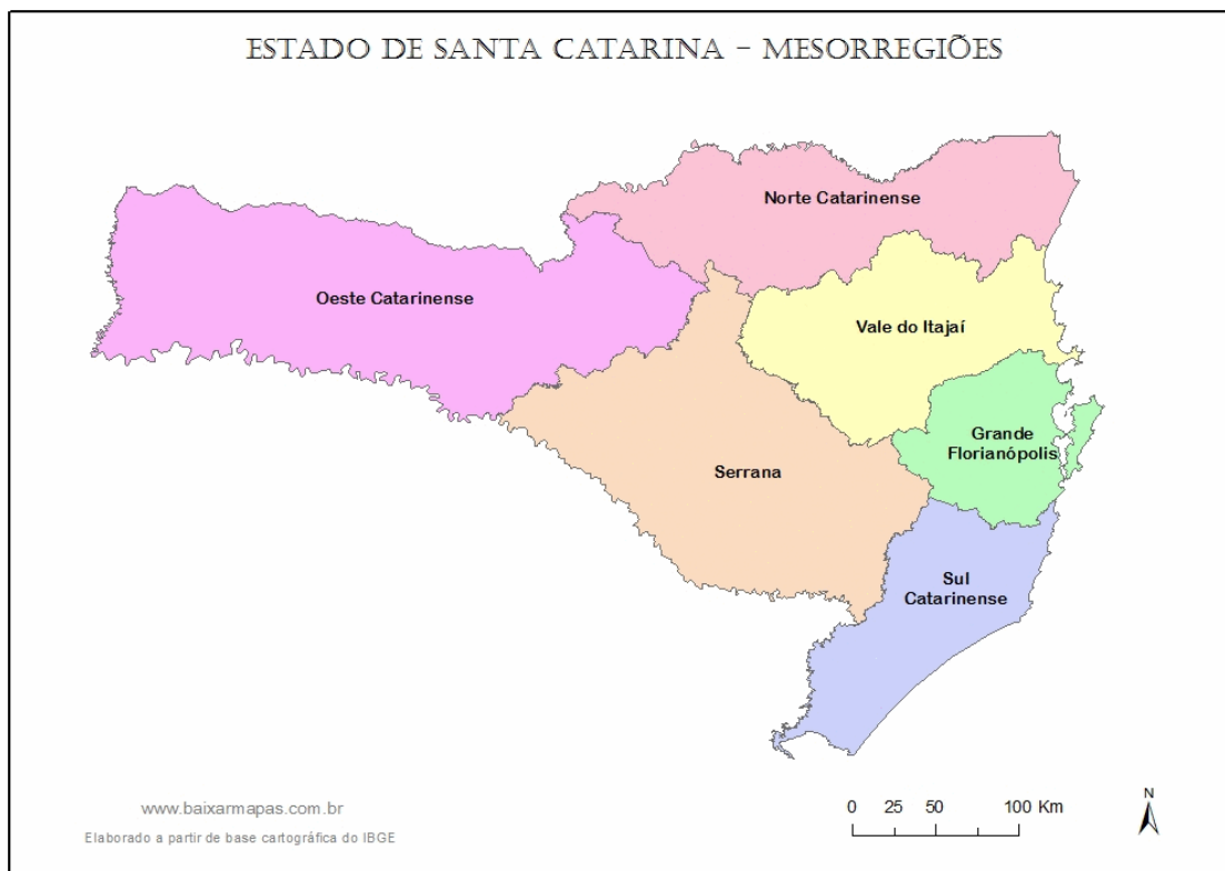
Figura 1- Mesorregiões do estado de Santa Catarina.