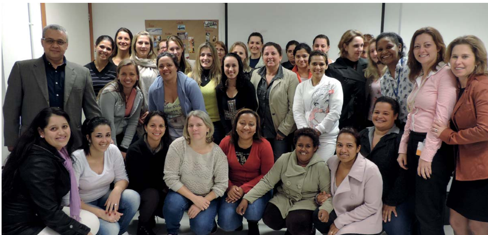
Abertura do curso de Atualização em Tratamento de Feridas para Técnicos e Auxiliares de Enfermagem em Florianópolis.