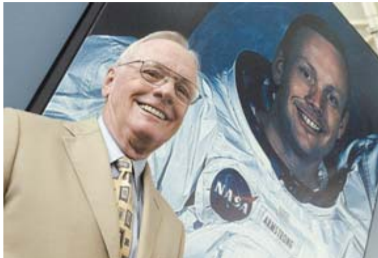
Armstrong posa em frente à própria foto, em museu de Valência

última aventura espacial de Armstrong. O comandante abandonou a agência espacial americana, em 1971, para ensinar Engenharia Aeroespacial na Universidade de Cincinnati, Ohio, até 1979. Em seguida, ocupou o cargo de conselheiro da administração em empresas, incluindo Lear Jet e United Airlines.